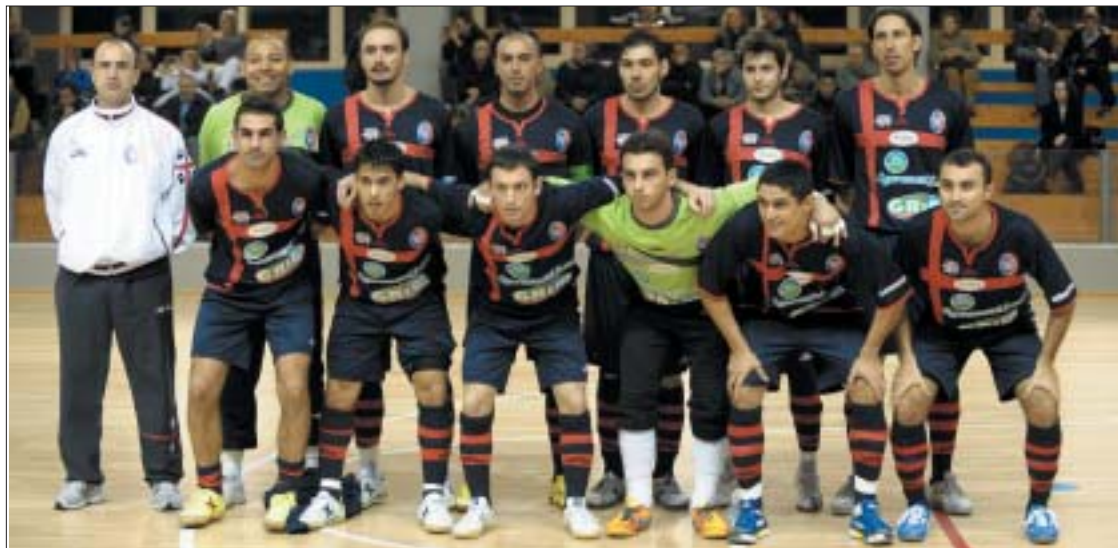
Una formazione dell'Atiesse impegnata nel campionato di Serie A 2009/2010