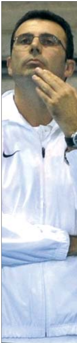
Mister Esposito guarda verso l'alto: la Cogianco ha rimesso nel mirino il Collevero (Cassella)