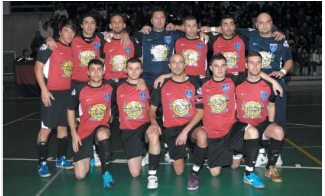
La formazione del Castel Fontana schierata prima della finale di Coppa Italia regionale (Cassella)

Applausi doverosi al Castel Fontana, indubbiamente la grande sorpresa della Final Four di Coppa Italia regionale che ad Ariccia ha incoronato, con legittimo merito, la Virtus Guidonia. E se non mancano i rimpianti per come la coccarda è sfuggita dalle mani dei marinisi (rigori a parte, rimane il forte dubbio della mancata espulsione del portiere tiburtino Pietrini per il fallo su Ernani che lo aveva superato e avrebbe potuto mettere in rete il pallone della sicurezza: per chi scrive una topica del primo arbitro), restano le certezze che la squadra vista all'opera al PalaKilgour potrà veramente giocarsela alla pari nella seconda parte del torneo, quando dovrà cercare con tutte le proprie forze di ridare tono ad una classifica che al momento la penalizza fortemente.