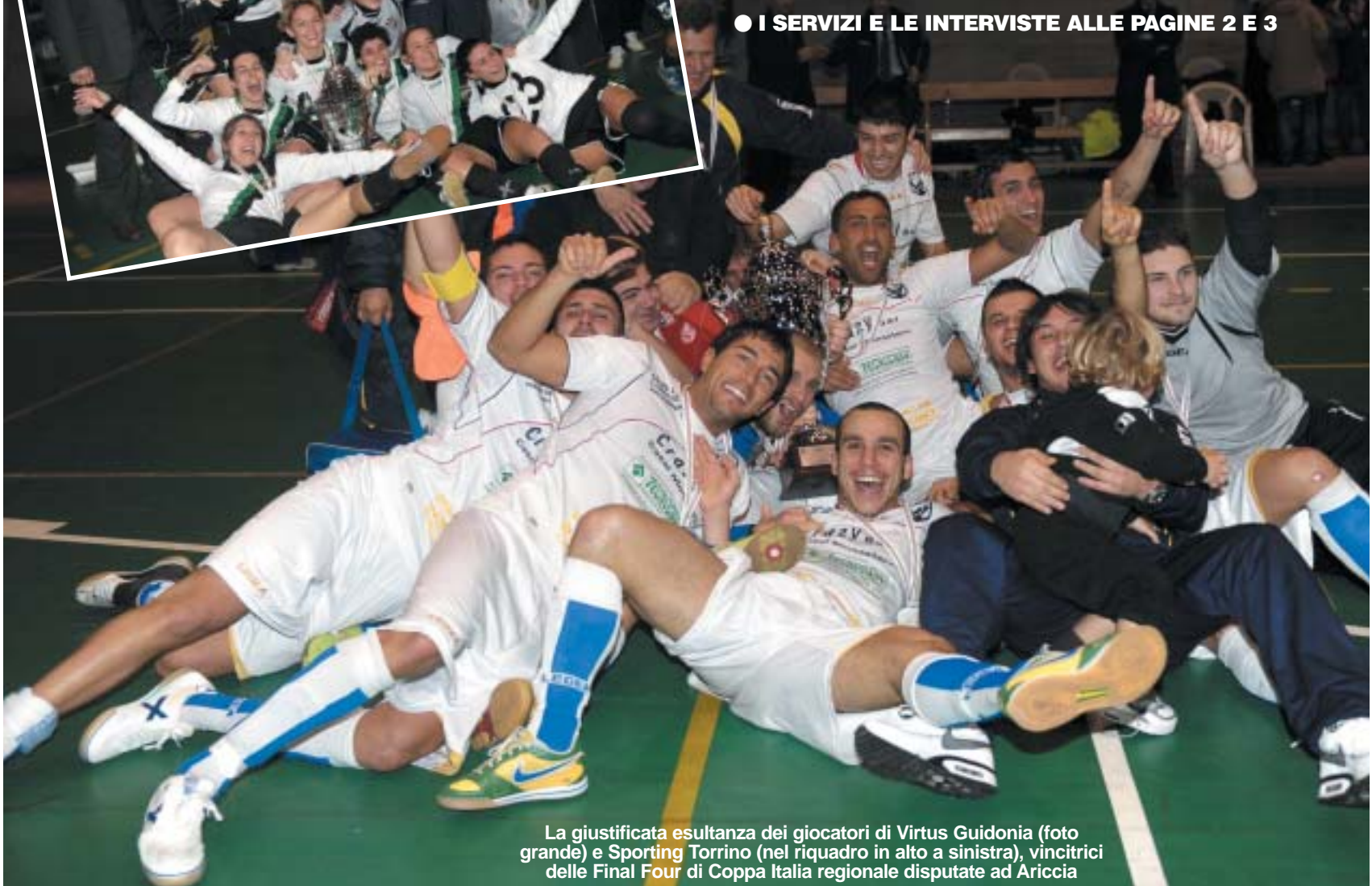
La giustificata esultanza dei giocatori di Virtus Guidonia (foto grande) e Sporting Torino (nel riquadro in alto a sinistra), vincitrici delle Final Four di Coppa Italia regionale disputate ad Ariccia

● I SERVIZI E LE INTERVISTE ALLE PAGINE 2 E 3