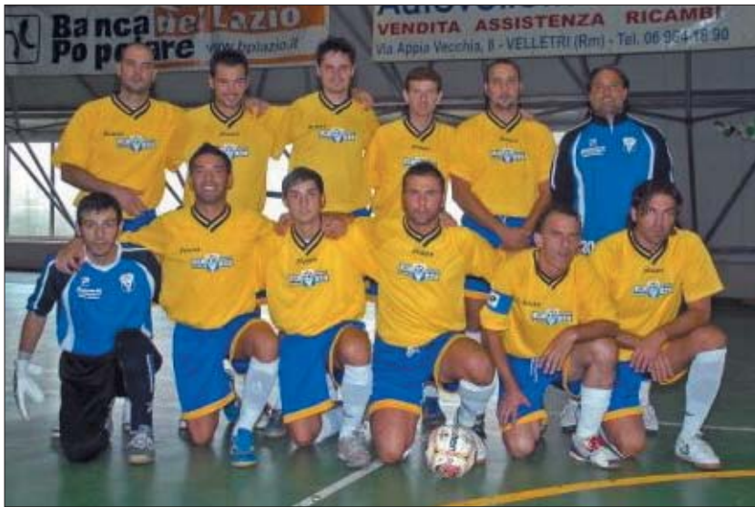
Una formazione della Simald 2009/2010