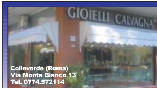
Colleverde (Roma) Via Monte Bianco 13 Tel. 0774.572114