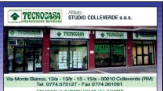
Colleverde (RM) Via Monte Bianco, 13/a - 13/b - 15 - 15/a - 00010 Colleverde (RM) Tel. 0774.573127 - Fax 0774.361091