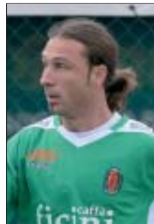
De Montis dell'Isola

Isola, è un esame decisivo in casa dell'Ostia