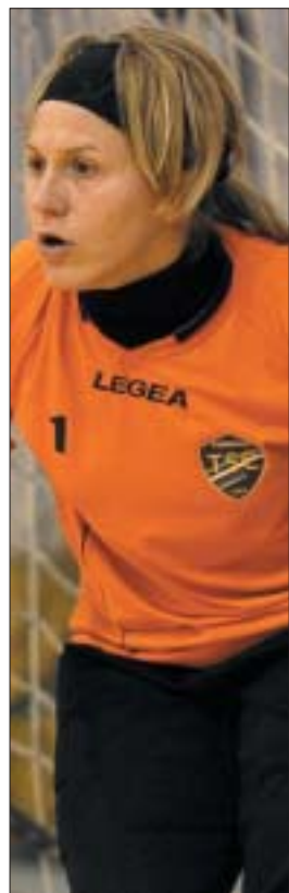
Paola Pierucci, premiata come miglior portiere della fase finale di Pescara

Il servizio fotografico è stato realizzato da PAOLO CASSELLA