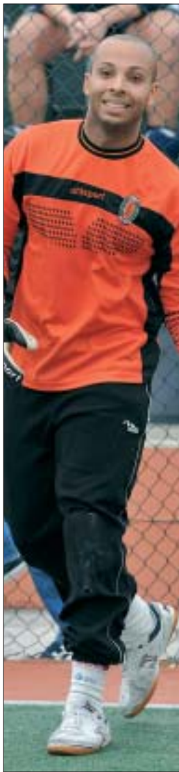
Ramos si sta confermando uno dei punti di forza dell'Isola, lanciato nella rincorsa alla capolista Stella Azzurra (Sammarco)

Ma fare un passo alla volta è la parola d'ordine nello spogliatoio virtuosino. Bisogna pensare, intanto a domani: ci sarà da affrontare un Morandi che, nonostante abbia perso le possibilità di lottare per la vittoria finale, si è più volte confermato squadra temibile, con giocatori tecnicamente molto validi: un ostacolo, dunque, da affrontare con la massima concentrazione, per iniziare nel migliore dei modi il primo degli scontri-chiave per la promozione.