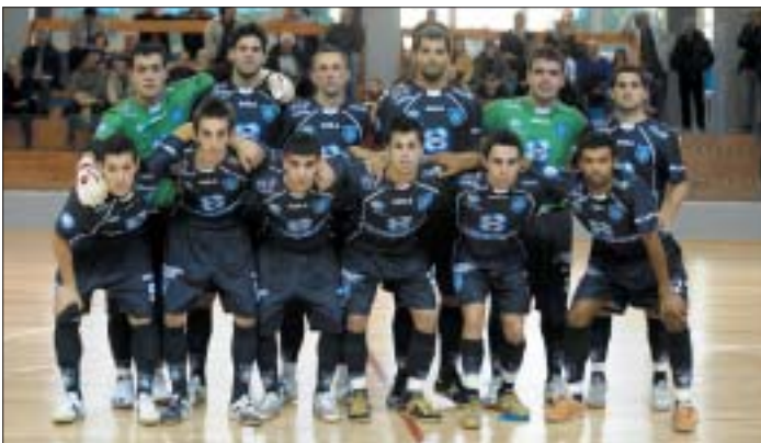
La Daf Montesilvano

Per gli abruzzesi, che hanno eliminato la Luparense, è la seconda finale di fila. I trevigiani, vittoriosi sul Bisceglie, sognano l'accoppiata Coppa-campionato