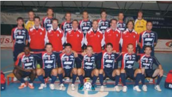
La Star Deco Cornedo, impegnata nei play-off per salire in Serie B

Si giocano in questo fine settimana le partite della seconda giornata dei triangolari validi per il primo turno della fase nazionale che conduce all'assegnazione di quattro posti nel prossimo campionato di Serie B. In programma anche le gare di andata di quattro dei cinque incontri ad eliminazione diretta, perché per il quinto, quello tra PCG Bresso e I Bassotti si giocherà la gara di ritorno dopo che il match di andata, anticipato a sabato scorso, ha visto la squadra lombarda imporsi a San Gillio per 4-2.