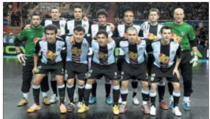
La Marca Futsal