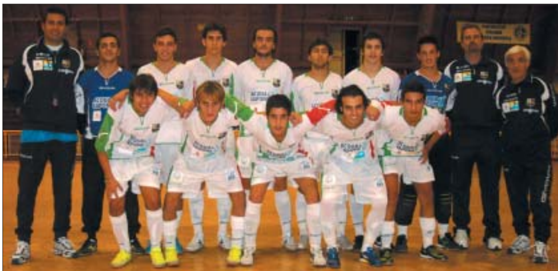
L'Under 21 dell'Acqua &amp; Sapone, in lotta per conquistare la finale-scudetto

Continua a fare bene la squadra Under 21 dell'Acqua & Sapone. Anche in semifinale - la gara di andata si è giocata al PalaCastagna di Città Sant'Angelo - gli angolani hanno battuto una delle formazioni considerate favorite per la vittoria dello scudetto, cioè il Terni.