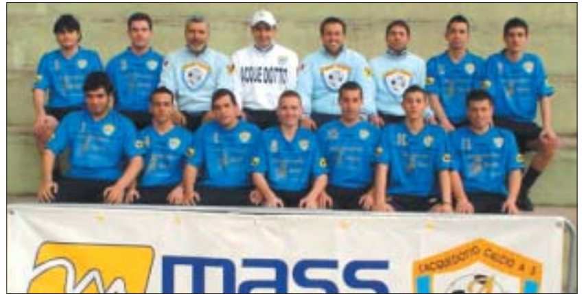
La rosa della Juniores de L'Acquedotto, neo-promossa nei regionali d'Elite

"Al primo anno di attività è davvero un risultato straordinario", dice giustamente soddisfatto il tecnico, che dopo la grossa prestazione col Valentia aveva chiamato i suoi alla "partita della vita". Detto, fatto e così l'Acquedotto ha guada-