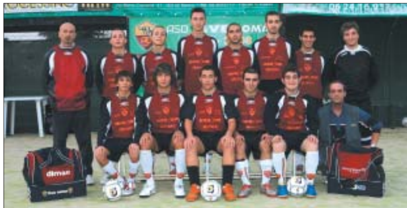
L'Under 21 della Five Roma, finalista regionale di categoria